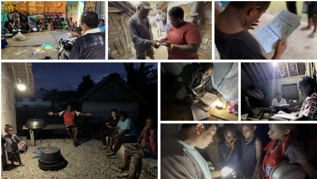
DEPにおけるバヌアツ共和国でのサービスの利用風景